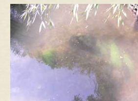
Collaboration des éléments en surface et en profondeur

Module de 2 jours (12 h). Intégrer les ressources de la Gestalt, du tarot, de la voix et de l'olfactothérapie à sa pratique. Augmenter la pertinence de mes interventions en établissant un cadre sécurisant pour les personnes. La question du groupe et la co-animation.