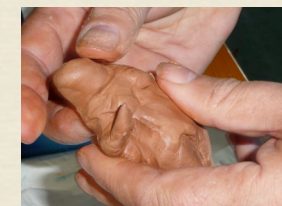
Émergence de la forme