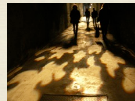
Sortir des ombres

Au cours de 5 jours (35 h) de formation nous apprendrons à nous centrer sur l'instant, sur la présence de soi (conscience du corps et/ou awareness) et de l'autre dans le champ relationnel. À travers des jeux de rôle s'appuyant sur la pratique de chacun, nous expérimentons le cycle du contact et le rôle de la frontière-contact dans la relation thérapeutique. À travers un parcours créatif explorer affect, sensation, sentiments, agressivité vitale. Nous évaluerons la nécessité d'organiser un cadre de fonctionnement.